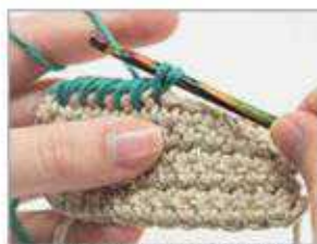
2 Den Faden bringt man über die