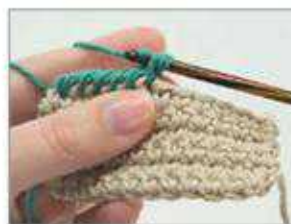
3 Den Faden erneut umschlagen und durch beide Schlingen ziehen.