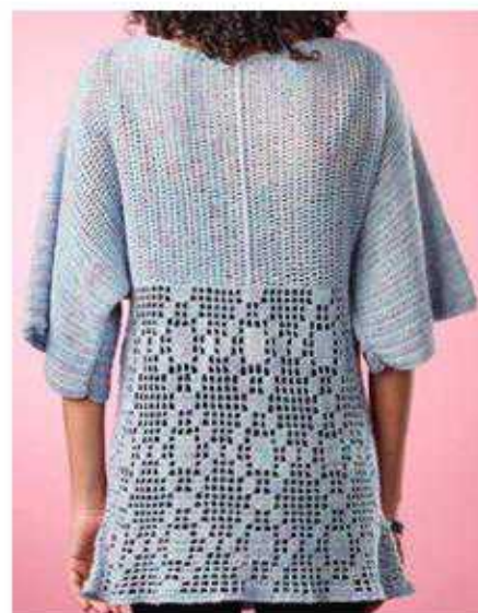
Die sichtbare Naht wird zu einem dekorativen Designelement.

Hinweis zur Häkelschrift: Den Filetabschnitt gemäß Häkelschrift auf der folg Seite arbeiten. Alle geraden Hin-R von rechts nach links, die ungeraden Rück-R von links nach rechts lesen. Die R immer mit 3 W-Lfm beg, diese zählen als Stb und sind nicht in der Häkelschrift aufgeführt. Die 27 M in der R so oft wie für die jeweiligen Größen angegeben wdh. Das letzte Stb der R in die 3. W-Lfm der Vor-R arbeiten. Fließtextanleitung und Häkelschrift sind auf einander abgestimmt. Ein weißes/leeres Kästchen steht für (2 Lfm, 2 M ausl, Stb in folg M) und jedes schwarze/gefüllte Kästchen für (Stb in folg 3 M). Die ersten 3 R der Häkelschrift sind zur besseren Übersicht ausgeschrieben.