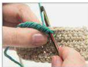
1 Die Krebsmaschen werden über