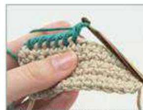
4 Eine Krebsmasche ist fertig.