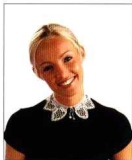
Creación: Mansur Ozbek

MATERIALES: 10 g de hilo de 6 cabos especial para puntillas, blanco; ganchillo de acero n° 0,75.