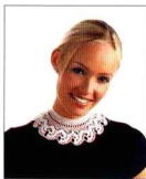
Creación: Sahmelek Tutan

MATERIALES: 15 g de hilo de Escocia nº 20, blanco; ganchillo de acero nº 1,25.